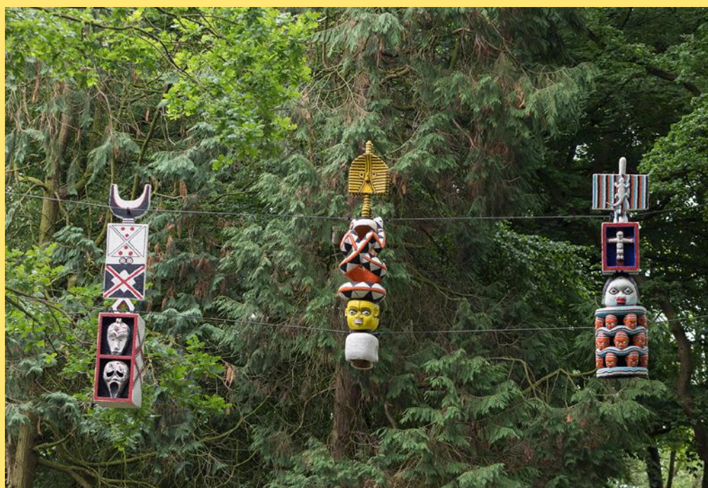
Alo-alo , sept totems, bois et perles, à proximité du dolmen D54 à Holtingerveld, province de Drent, Hollande, biennale Into Nature: Out of Darkness, 2018.